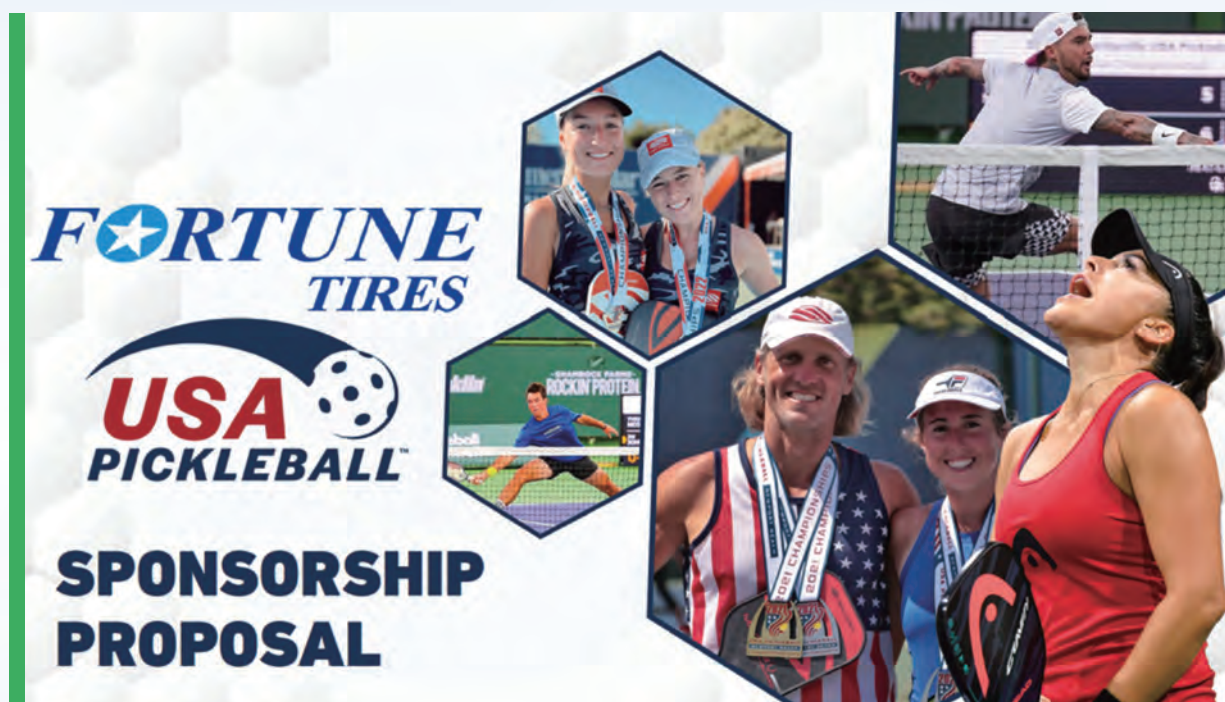
2023年3月富神輪胎(Fortune Tires)成為美國USA Pickball官方獨家輪胎贊助商

2023年浦林成山北美分公司與美國匹克球運動聯盟USA Pickleball達成合作，浦林成山旗下輪胎品牌富神輪胎(Fortune Tires)成為USA Pickleball的官方獨家輪胎贊助商。自2019年進入美國市場以來，浦林成山富神輪胎(Fortune Tires)以不斷精進的技術革新，為北美用戶創造性能全面的高質量輪胎解決方案，在北美地區的品牌影響力持續提升。隨著浦林成山全球市場的加速佈局與全新國際化產品矩陣與品牌形象的亮相，富神輪胎「Driving Forward (澎湃於心，勇者自強)」的品牌理念也正在與北美用戶建立更深的連接。富神輪胎在為用戶提供安全、優質、高性能出行用胎方案的同時，也成為積極生活方式的倡導者。