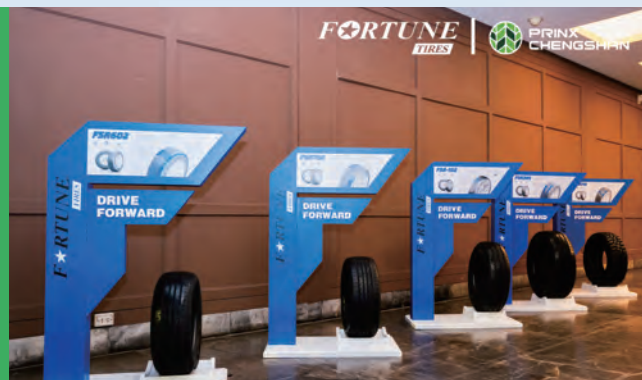
2023年10月，浦林成山旗下的富神乘用車輪胎（「PCR」）在泰國舉行經銷商會議