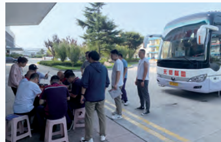
2023年山東工廠參加社區無償獻血活動