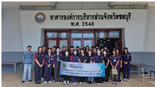
2023年泰國工廠參加社區無償獻血活動

報告期內，本集團與泰國當地政府機關及民眾建立了友好關係，於2023年9月當地儂色倉幼兒園捐贈一台冰箱。於2023年6月，泰國工廠參加儂色倉鎮政府和泰國工業廳聯合舉辦「種植活動」並捐贈了10件礦泉水。於2023年6月，本公司位於泰國的工廠（「 泰國工廠 」）組織開展社會責任(CSR)活動，為儂色倉幼兒園捐贈了塑料水箱、兒童日常生活用品等。2023年8月和10月本集團山東工廠和泰國工廠分別組織員工參與社區無償獻血活動，用血液傳遞愛心，用愛心為生命加油！