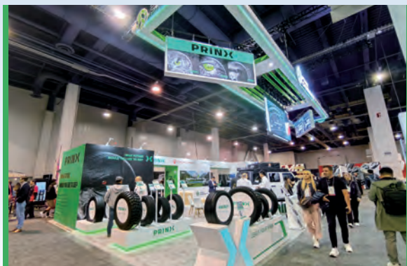
2023年10月，浦林成山參加美國拉斯維加斯的國際改装車及配件展覽會